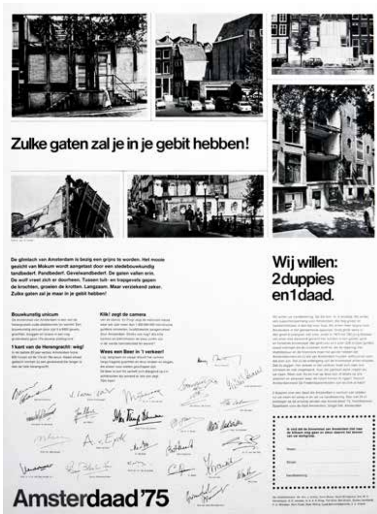
11 Amsterdaad '75, affiche, 1967.