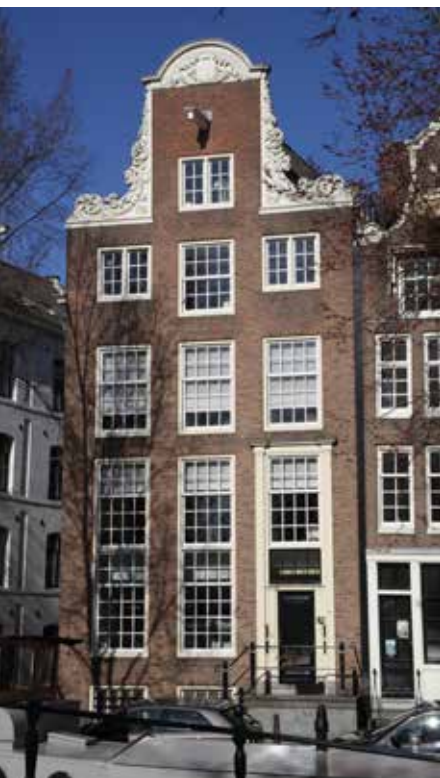
15 Raamgracht 17, herbouwd in 1976 met een door Hans 't Mannetje nieuw gehakte geveltop. Foto Walther Schoonenberg, 2017.

situatie van de binnenplaats samenviel met de nieuwe functie van het gebouw, namelijk trouwlocatie, waarvoor de stoep naar de grote zaal nodig was. De volgebouwde binnenplaats maakte dit belangrijke monument onbruikbaar voor die nieuwe functie, die de redding van het gebouw was. De Rijksdienst zag het anders: de aanbouwen op de binnenplaats vormden in haar visie een belangrijk hoofdstuk in de bouwgeschiedenis van het pand. Brinkgreve kreeg toch zijn zin: het restauratieplan werd uitgevoerd.